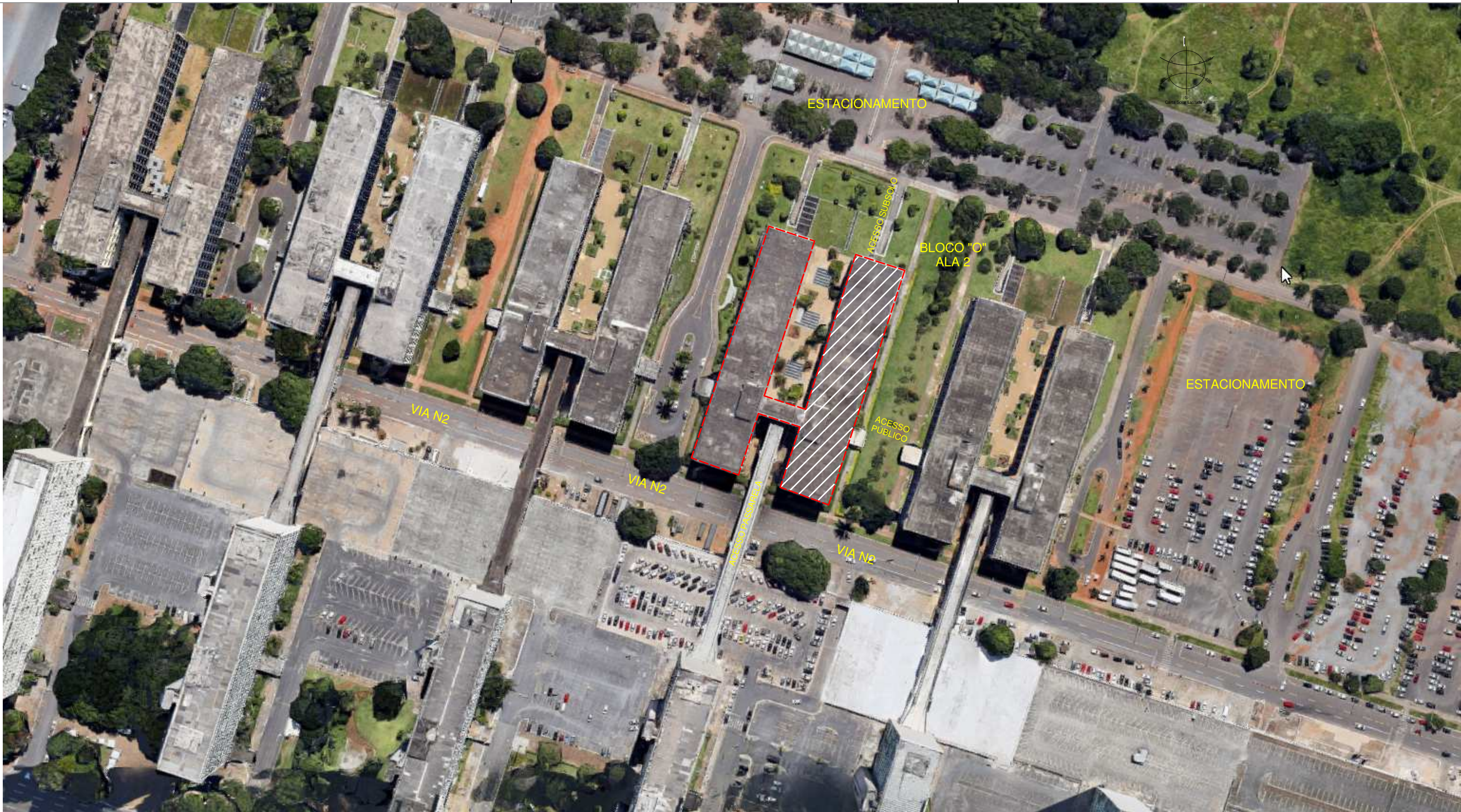
1 IMAGEM - AÉREA LOCALIZAÇÃO SEM ESCALA